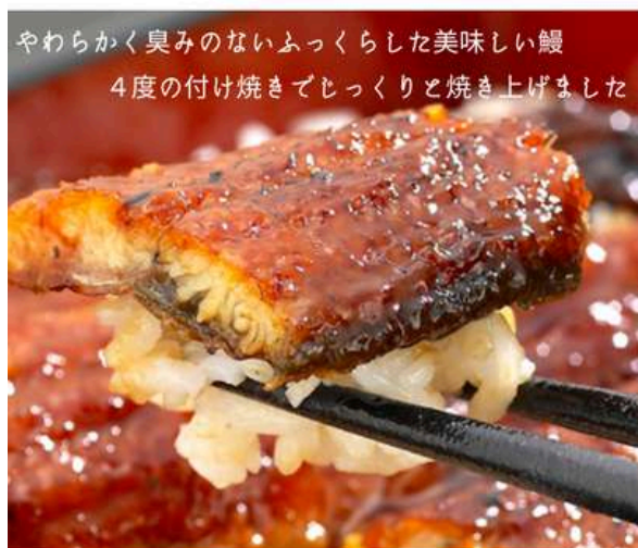
やわらかく臭みのないふっくらした美味しい鰻 4度の付け焼きでじっくりと焼き上げました