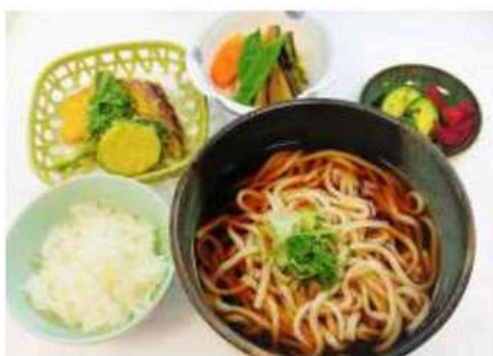
※写真はかけうどんセットです。