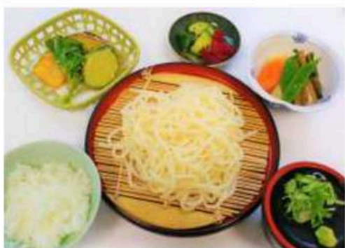
※写真はざるうどんセットです。