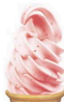
ブルーベリー & ヨーグルト