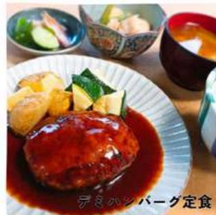
デミハンバーグ定食