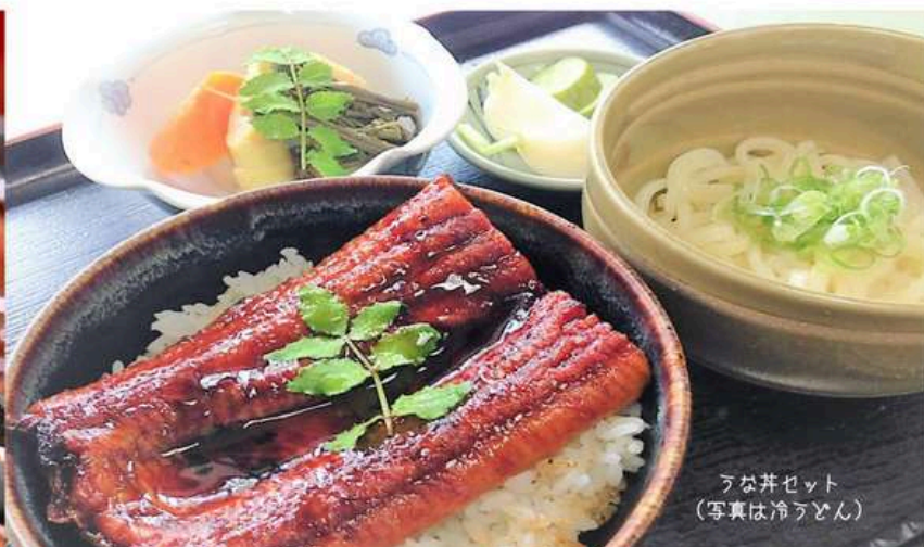
うな丼セット （写真は冷うどん）