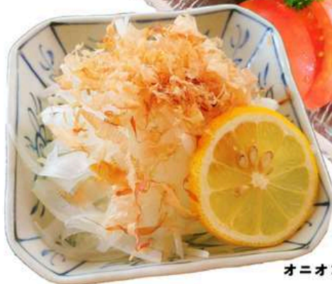
オニオンスライス