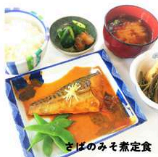
さばのみそ煮定食