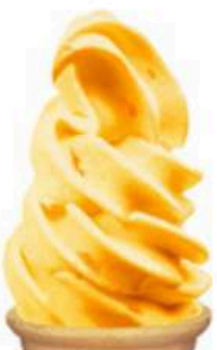
期間限定 フレーバー