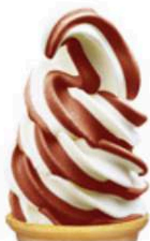
バニラ & チョコレート