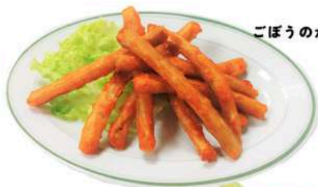
ごぼうのから揚げ