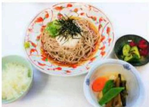
※写真は冷たいとうろそばセットです。